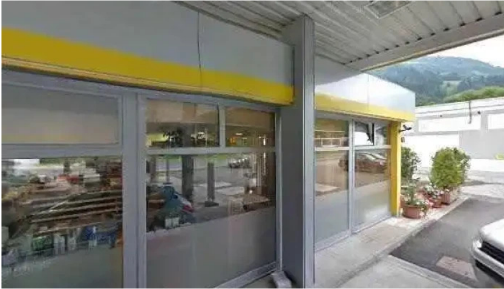
Eni street view 360deg fotos