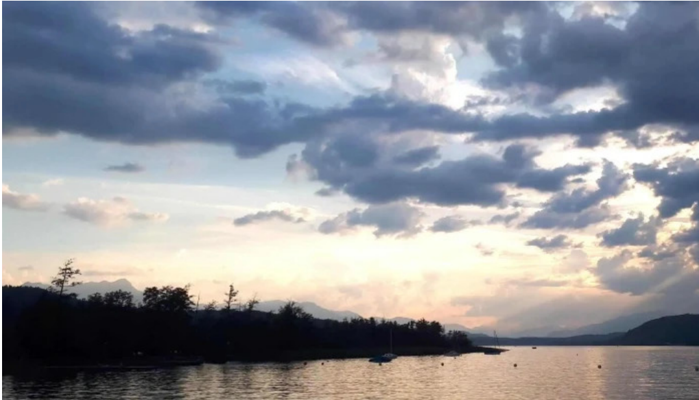
Promenadenbad der gemeinde portschach am worther see offnungszeiten