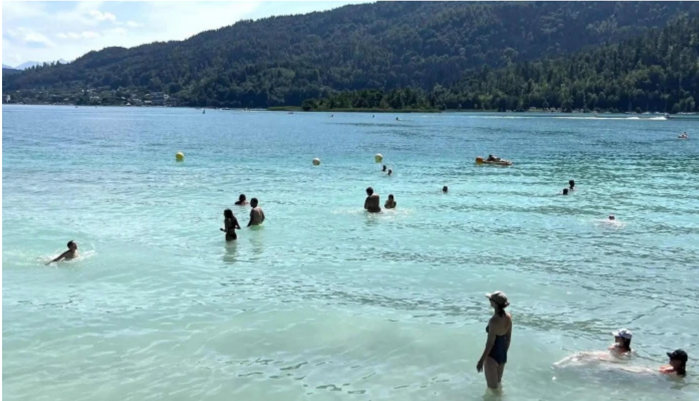
Promenadenbad der gemeinde portschach am wörther see adresse