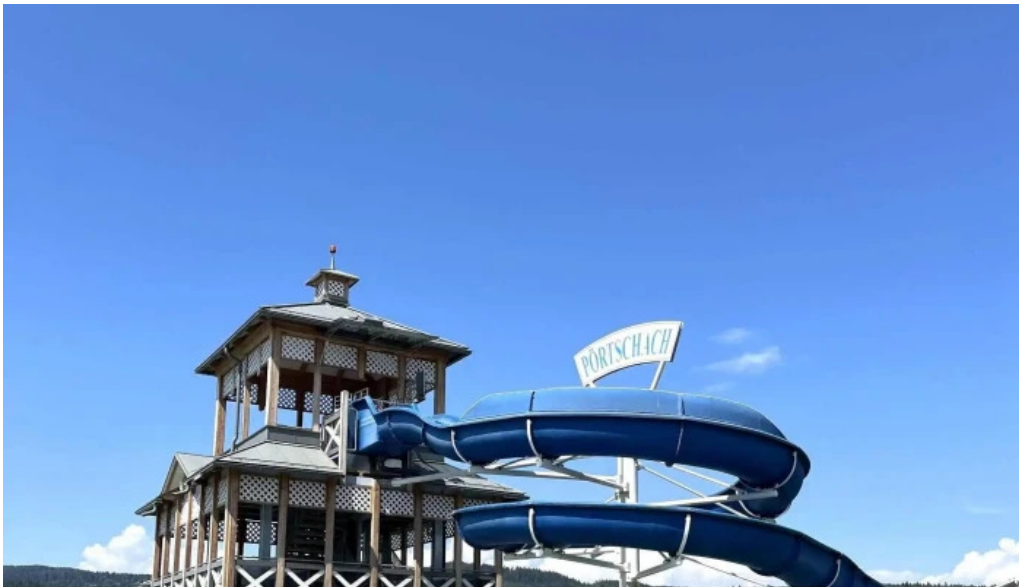
Promenadenbad der gemeinde portschach am worther see portschach am worthersee