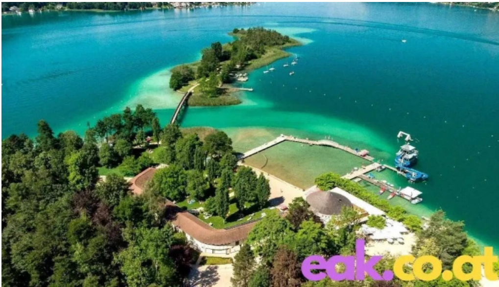
Promenadenbad der gemeinde portschach am worther see alle