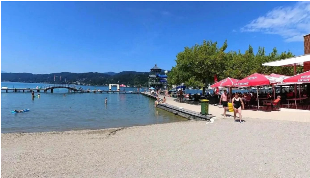
Promenadenbad der gemeinde portschach am worther see street view 360deg fotos