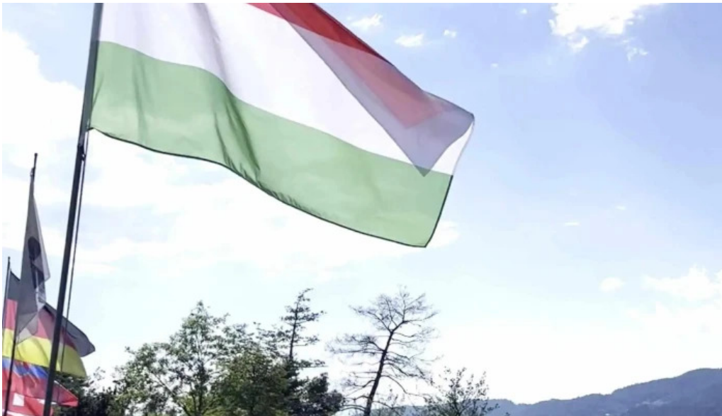
Promenadenbad der gemeinde portschach am worther see katalog