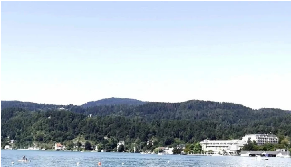
Promenadenbad der gemeinde portschach am worther see offentliches bad