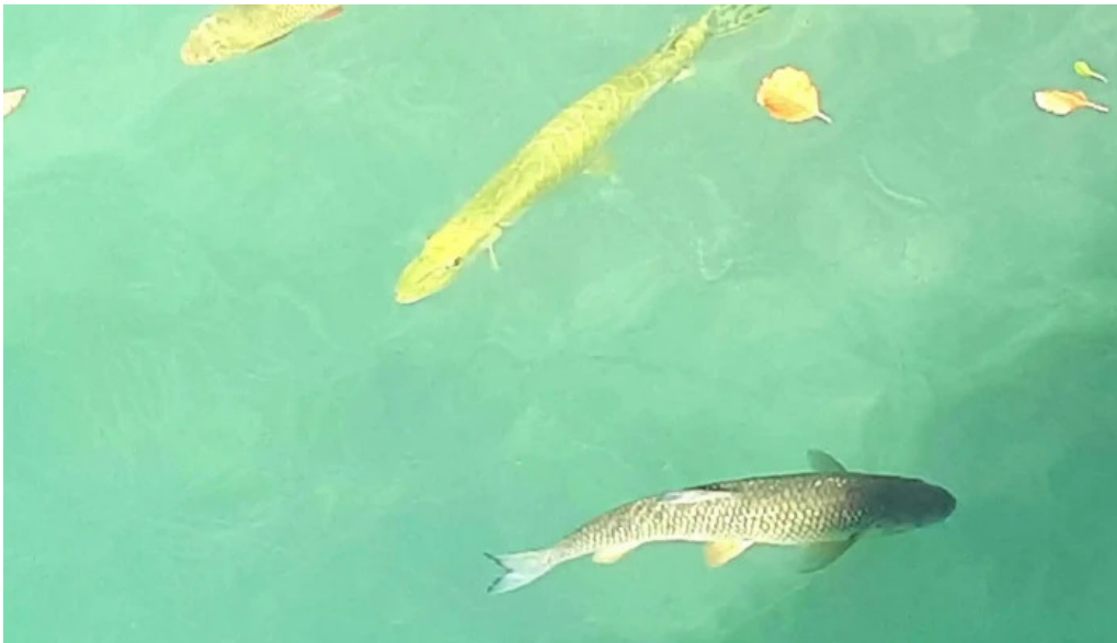
Promenadenbad der gemeinde portschach am worther see meinungen