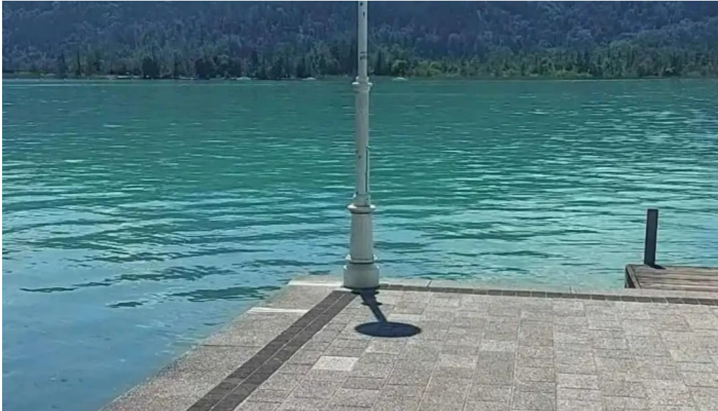
Promenadenbad der gemeinde portschach am worther see strand