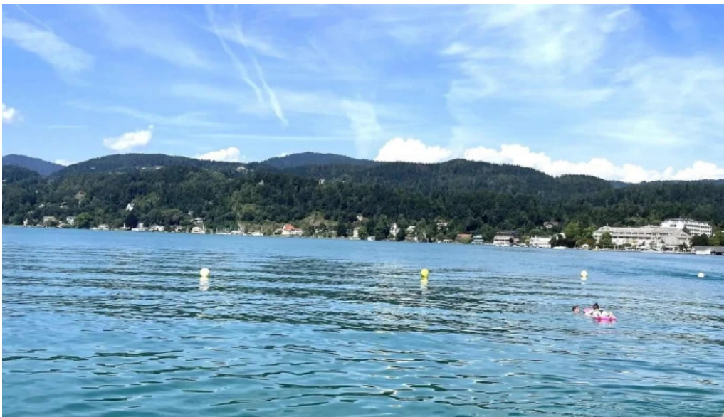
Promenadenbad der gemeinde portschach am worther see bewertung