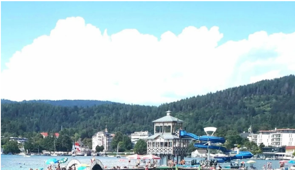
Promenadenbad der gemeinde portschach am worther see aktion