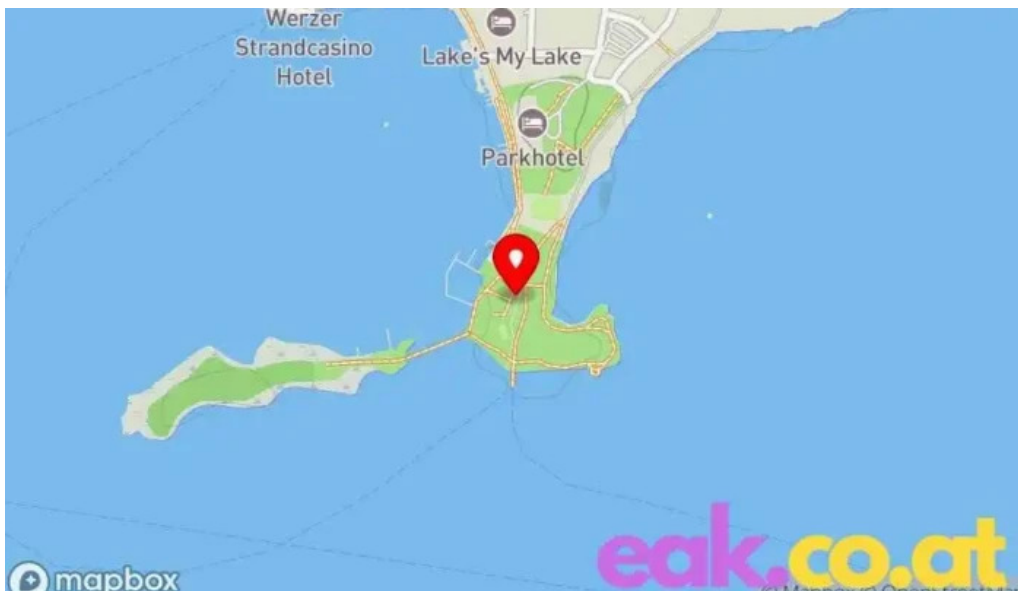
Promenadenbad der gemeinde portschach am worther see karte