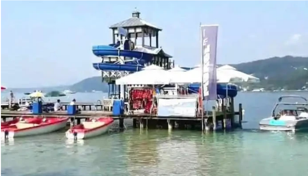
Promenadenbad der gemeinde portschach am worther see videos