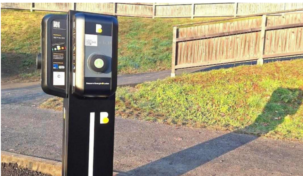
Burgenland energie ladestation spittal an der drau