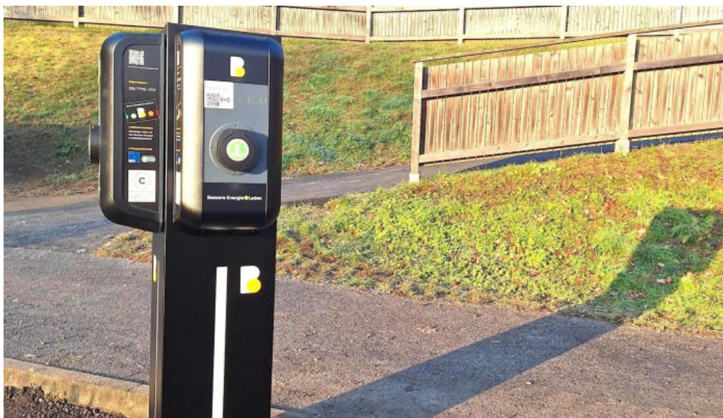
Burgenland energie ladestation alle