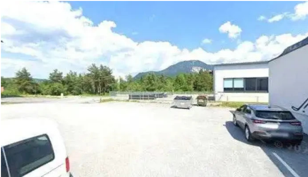
Stadtwerke klagenfurt ladestation alle